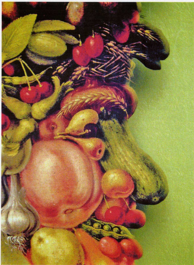
Extrait de l'affiche de présentation de l'exposition « Des légumes dans tous leurs états ».

Nathalie LE GALIARD 01 64 87 37 81 nathalie.le-galiard@cg77.fr