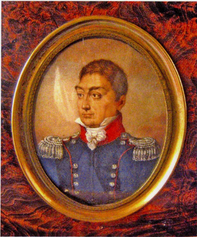
LA FAYETTE.