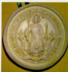
Exemple de sceau fabriqué à partir de la malle du service des publics. Sceau de Charles VI - (1392) « KAROLUS DEI GRACIA FRANCORUM REX »