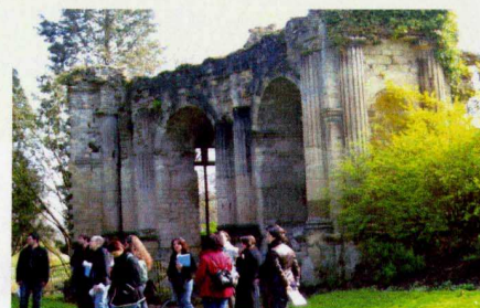
Parc des Capucins à Coulommiers. Cliché pris au cours du stage OUV 0204A1 « Découvrir le patrimoine de la Seine-et-Marne et ses ressources culturelles ».

Les médiateurs culturels au service des publics aux Archives départementales de Seine-et-Marne :