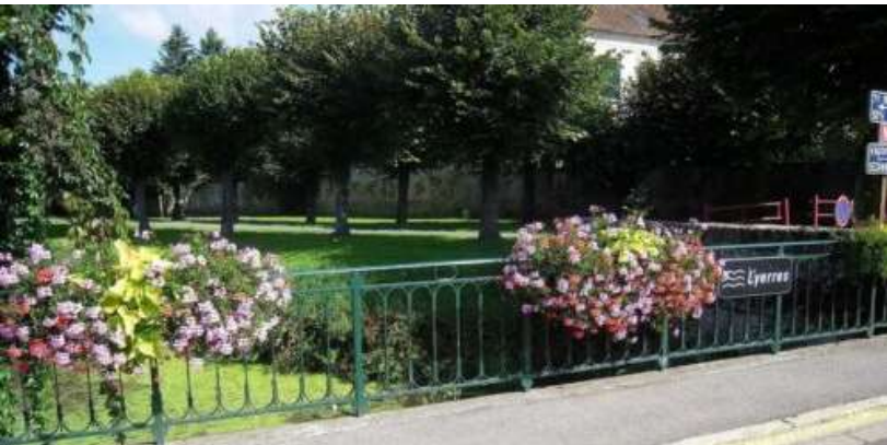
La promenade vue depuis le pont de l'Yerres.

Le but est d'embellir la ville, de la rendre agréable aux habitants, mais aussi de développer le tourisme et surtout de lutter contre le réchauffement climatique (ce qui correspond à l'objectif n°13 des ODM). Ces efforts sont récompensés. En 2025, la ville a obtenu sa "première fleur" par le département. Et le maire espère déjà obtenir la deuxième !