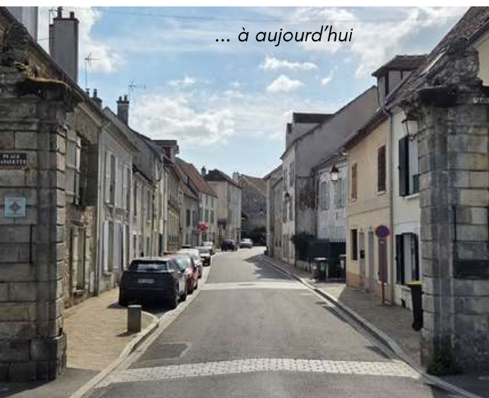
... à aujourd'hui