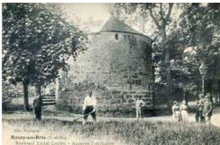
La tour du boulevard Courbet.

Au Moyen-Âge, il y avait treize tours autour des remparts pour assurer la sécurité des habitants. Un chemin de ronde, accessible uniquement par l'intérieur de la ville, permettait de passer d'une tour à l'autre. Aujourd'hui, il ne reste que huit tours qui ont été restaurées au fil des siècles. Longtemps propriété de la ville, les tours et les remparts sont maintenant des propriétés privées.