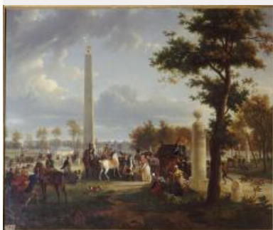
26. J.L Demarne et A.H Dunouy, La rencontre de l'Empereur Napoléon Ier et du Pape Pie VII dans la forêt de Fontainebleau, 1808, huile sur toile, 193X228 cm, château de Fontainebleau

La première rencontre entre Napoléon et Pie VII a lieu le 25 novembre 1804 en forêt de Fontainebleau. Le pape, venu à Paris sacrer l'empereur, arrive de Rome et fait une halte au château avant la cérémonie. A son approche, au carrefour forestier de la croix de Saint-Herem, Pie VII a la malencontreuse surprise de rencontrer Napoléon simulant une chasse en forêt. Sur ce tableau, les peintres mettent en scène l'empereur, simplement vêtu d'un habit de vènerie, qui reçoit sans protocole le pape descendu de sa voiture. La croix de Saint-Herem cède la place à un obélisque sommé d'une aigle d'or, rehaussant l'empereur au détriment du chef de l'Eglise.