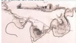
31. Détail de la carte de tracé du canal entre Claye et Varreddes, par Pierre-Simon Girard, 1803 (AD77, 4°435/2)