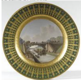
32. Peinte par Sweebach, Assiette, le Canal de l'Ourcq, Manufacture impériale de Sèvres, porcelaine dure