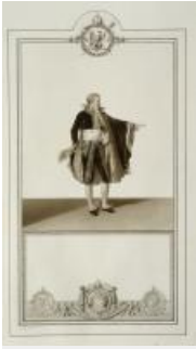
16. Livre du sacre, dessin de l'habillement d'un sénateur