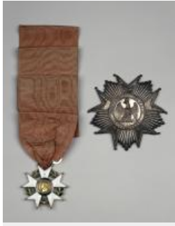
20. Plaque de l'ordre de la Légion d'honneur, XIXème siècle, fil d'argent, paillettes d'argent, broderies