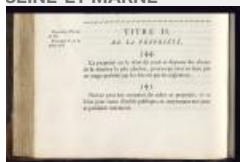
21. Article 544, Code civil des Français : édition originale et seule officielle, Paris : Imprimerie de la République, 1804, page 134 (AD77, 4°2735).