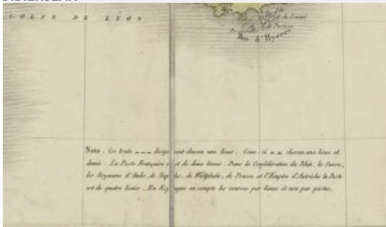
30. Carte des routes des postes de l'Empire français, du royaume d'Italie et de la Confédération du Rhin, carte papier, 126,50 x 143,50