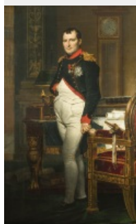
23. David, Jacques-Louis, Napoléon Ier dans son cabinet de travail des Tuileries, 1811, huile sur toile, 205 x 128 cm

C'est un riche écossais admirateur de Napoléon, le marquis de Douglas, qui commande en 1811 à David un portrait de l'Empereur. Napoléon y est figuré dans son cabinet des Tuileries, l'horloge indiquant précisément quatre heures du matin. Sur le bureau, la plume et les papiers épars signalent que l'empereur a passé la nuit à travailler à son œuvre juridique la plus importante : le Code civil. Le tableau offre ainsi le portrait moral d'un empereur sacrifiant ses nuits à souder un peuple en lui donnant des lois. En contrepoint au portrait d'apparat traditionnel, David crée une effigie du pouvoir plus moderne, qui renoue avec la figure voltairienne du « Grand Homme » forgeant l'Histoire.