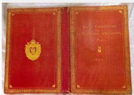
27. Portefeuille lié au culte luthérien à Paris, 1809, 25,8 x 38 cm

En 1802, Napoléon autorise les cultes protestants, réformé et luthérien. En 1806 est ainsi fermée la chapelle de l'ambassade de Suède où le culte était célébré depuis 1626. Grâce à l'appui du général Rapp arguant du nombre considérable de luthériens à Paris, l'Empereur établit, par le décret du 11 août 1808, l'église consistoriale de Paris comme dépendant du Temple-Neuf de Strasbourg, et attribue à ce culte une église parisienne. A côté du catholicisme reconnu par le Concordat comme « religion de la majorité des Français », les confessions protestante et juive sont aussi tolérées et encadrées par la loi de l'Empire, ce dont témoigne ce portefeuille luthérien. La lyre ( https://archives.seine-et-marne.fr/fr/glossaire-premier-empire ) d'Apollon qui y figure invite à penser qu'il devait servir de pupitre renfermant des partitions musicales servant à l'office religieux. Quant aux grandes armes de l'Empire français, elles expriment la liberté de cultes garantie par la loi de l'Etat.