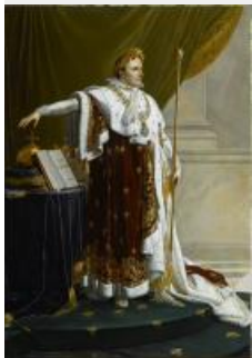
22. Girodet de Roussy-Trioson Anne-Louis, portrait de Napoléon Ier en souverain législateur, peinture, 261 x 184 cm

À l'apogée de l'Empire, le peintre Girodet reçoit commande, en février 1812, d'une représentation de l'Empereur en trente-six exemplaires destinés à chacune des cours d'appel de l'Empire. Cette image officielle du souverain, vêtu du grand manteau impérial fourré d'hermine et portant le grand collier de la Légion d'honneur, dégage une impression de puissance et de stabilité. Aux classiques symboles de l'Empire (sceptre tenu dans la main gauche, main de justice et globe posés sur un coussin reposant sur une table), s'ajoute un attribut explicite du souverain législateur : à la différence des rois qui juraient sur les Évangiles de respecter les lois fondamentales du royaume, c'est sur le Code Civil de 1804 – nommé « code Napoléon » dès 1807 – que l'Empereur prête serment.