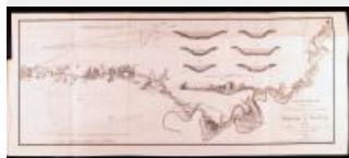
31. Carte du territoire que doit traverser le canal de dérivation de la rivière d'Ourcq depuis le village de Mareuil jusqu'à Paris avec le tracé de ce Canal, par Pierre-Simon Girard, 1803 (AD77, 4°435/2)

Parmi les réalisations intérieures, le canal de l'Ourcq s'impose. Le point de vue choisi met en valeur les berges du canal, aménagées en chemin de halage. Une charrette, chargée de fourrage peut-être destiné à l'armée, franchit un pont qui enjambe le canal. Ce n'est pourtant que le 15 août 1813 que les premiers bateaux (dits flûtes de l'Ourcq) peuvent naviguer sur une section longue de 27 km entre Claye-Souilly et Paris. Il s'agit donc d'une représentation du canal anticipant son achèvement.