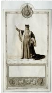
16. Livre du sacre, dessin de l'habillement d'un ministre Grand Juge