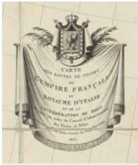
30. Carte des routes des postes de l'Empire français, du royaume d'Italie et de la Confédération du Rhin, carte papier, 126,50 x 143,50 ©(C)RMN-GP (CHÂTEAU DE FONTAINEBLEAU)/ADRIEN DIDIERJEAN