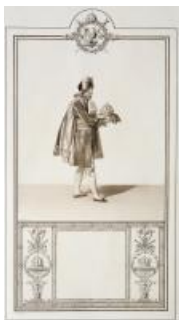
16. Livre du sacre, dessin de l'habillement d'un maréchal d'Empire