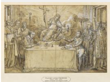
25. Desrais Claude-Louis, signature du Concordat par Pie VII et Napoléon Bonaparte, après 1804, dessin, 0,20x30,20 cm

Signé le 15 juillet 1801 aux Tuileries, le texte du Concordat déclare la religion catholique « religion de la grande majorité des citoyens français ». L'illustrateur, Desrais, peu soucieux de l'exactitude historique, donne une dimension allégorique à l'événement. Assise sur des nuées, la figure de la Religion, tenant une croix, plane au-dessus de la table réunissant les deux protagonistes. Leurs traits sont ceux de Pie VII et de Napoléon alors que les véritables signataires du Concordat furent le cardinal Consalvi et Joseph Bonaparte. Napoléon est vêtu d'un manteau de cour, ce qui laisse supposer que l'exécution de ce dessin est postérieure à 1804, année d'instauration de l'Empire.