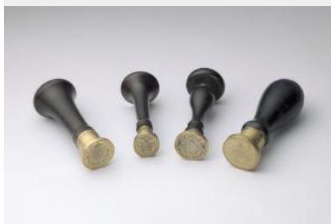
24. Cachets aux armes de Régnier comme comte de l'Empire. Cachets aux grandes armes de Régnier comme comte de Massa, bois, vernis, laiton