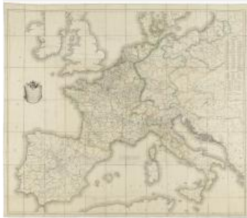
30. Carte des routes des postes de l'Empire français, du royaume d'Italie et de la Confédération du Rhin, carte papier, 126,50 x 143,50

Cette carte imprimée sur papier exprime la domination napoléonienne sur l'Europe en 1811. Elle présente le réseau des routes de postes impériales ( https://archives.seine-et-marne.fr/fr/glossaire-premier-empire ) qui ont pris le relais des routes royales. Ce réseau routier stratégique, favorisant le déplacement des armées et la circulation des informations d'un point à l'autre de l'Empire, est particulièrement développé vers l'Italie. Il témoigne de l'apogée de l'emprise napoléonienne sur la péninsule après l'invasion en 1806 du royaume de Naples, l'annexion de la Toscane en 1808 et des Etats Pontificaux en 1809. Rome s'est alors imposée en deuxième capitale de l'Empire, après Paris et avant Amsterdam.