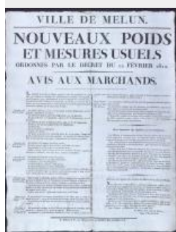
28. Affiche annonçant les nouveaux poids et mesures usuels ordonnés par le décret du 12 février 1812 (AD77, M7772).

Les moyens économiques développés sous le Premier Empire permettent l'uniformisation ou la modernisation de différents pans de l'économie en France. Ils sont également, pour Napoléon, un moyen de diffusion du modèle napoléonien, de propagande. Cette affiche est une illustration locale de cette politique à l'échelle du territoire de l'Empire. Le 12 février 1812, un décret ( https://archives.seine-et-marne.fr/fr/glossaire-premier-empire ) impérial ordonne l'utilisation par les marchands de nouveaux poids et mesures basées sur le gramme, le mètre et le litre - des unités de mesures décrétées sous la Révolution pour mettre fin à la multiplicité des unités existants sous l'Ancien Régime. L'objectif est de « garantir les consommateurs des abus qui pouvaient exister ». Cette affiche publiée et diffusée par la ville de Melun détaille les différentes références désormais en vigueur. C'est d'ailleurs en Seine-et-Marne, entre Lieusaint et Melun, qu'ont été prises les mesures destinées à établir le mètre étalon.