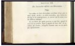
21. Article 745, Code civil des Français : édition originale et seule officielle, Paris : Imprimerie de la République, 1804, page 182 (AD77, 4°2735).