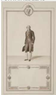
16. Livre du sacre, dessin de l'habillement d'un maire