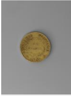
29. Pièce de monnaie de 40 francs or, République française, an XI, 1803, or