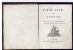
21. Code civil des Français : édition originale et seule officielle, Paris : Imprimerie de la République, 1804, 579 p. (AD77, 4°2735)

Diffusé pour affirmer le modèle français dans tout l'Empire au gré des conquêtes napoléoniennes, il connaît un rayonnement important.