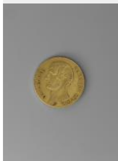
29. Pièce de monnaie de 40 francs or, République française, an XI, 1803, or

Le franc germinal est créé en avril 1803 soit en germinal de l'an XI selon le calendrier révolutionnaire, ce qui donne son nom à la nouvelle monnaie. Durant la Révolution française, les pièces en métal précieux disparaissent peu à peu de la circulation pour être fondues. Il devient alors nécessaire d'établir une nouvelle monnaie pour retrouver une stabilité financière. Cette pièce de 40 francs or est gravée du profil à l'antique de Napoléon et de l'inscription « Bonaparte Premier Consul ». Ce type de monnaie permet, comme dans l'Antiquité, de véhiculer l'image du Consul, puis du souverain, à travers l'Empire. Le 18 janvier 1800, Napoléon crée la Banque de France, qui obtient le monopole d'émission de billets de francs germinal alignés sur une valeur d'or équivalente. La Banque de France encourage le commerce et l'industrie en facilitant les emprunts et en augmentant la quantité d'argent en circulation. En 1808, Napoléon crée la Bourse de Paris dont le rôle est de faciliter les échanges de produits dans des conditions de sécurité satisfaisantes pour l'acheteur et le vendeur. Elle contribue ainsi à la stabilité commerciale et financière rétablie par Napoléon.