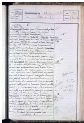
Exemple d'un acte transcrit dans un bureau des Hypothèques en 1955 (AD77, 4Q3/9/266).

L'hypothèque est un droit réel, immobilier et indivisible dont est grevé un bien immeuble pour garantir le paiement d'une créance. Elle existe déjà sous l'Ancien Régime. L'inscription (faite à la demande du créancier) et la ranscription (faite à la demande de l'acquéreur ou du donataire) d'une hypothèque permettent de faire connaître et l'affectation hypothécaire d'un bien à la sûreté d'une créance. Elles deviennent obligatoires en 1798 (loi du 11 brumaire an VII).