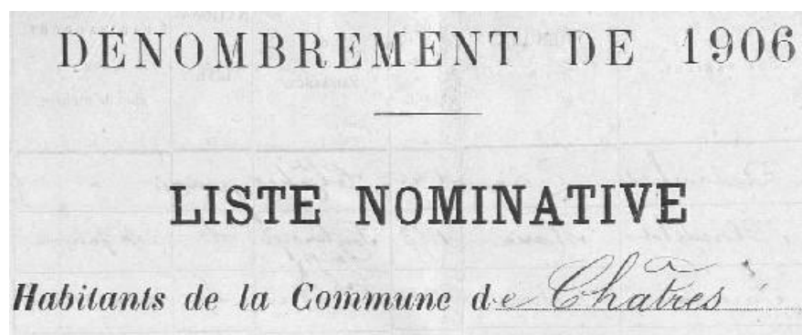
Liste du canton de Tournan en 1906, image 1 (AD77, 10 M 424)

Les recensements de population apparaissent en France au moment de la Révolution et sont mieux encadrés et systématisés au cours du XIX e siècle.