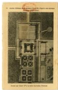
Plan du XVI e siècle montrant ce à quoi ressemblaient le château et ses jardins au temps des "trois reines". Carte postale du Château de Montceaux-lès-Meaux, 1981. (AD77, 2Fi8753)

Aujourd'hui, il ne reste que des ruines de l'entrée principale et d'une façade. Néanmoins, en 2005, le château et son domaine de 17 hectares - devenus une propriété privée - sont classés Monuments historiques . En 2009, ils sont vendus. Les nouveaux propriétaires souhaitent les préserver et en faire un lieu culturel Ils lancent en 2014 une souscription publique nationale pour un sauvetage d'urgence , en collaboration avec la Fondation du Patrimoine, la DRAC Ile-de-France et le Conseil départemental de Seine-et-Marne.