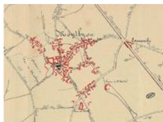
Plan extrait de la monographie de Monthyon (AD 77, 30 Z 276)

Non, il n'existe pas actuellement dans les fonds des Archives départementales une monographie pour chaque commune du département. Certaines monographies n'ont pas été réalisées ; d'autres sont perdues ou peuvent parfois être conservées dans les communes d'origine.