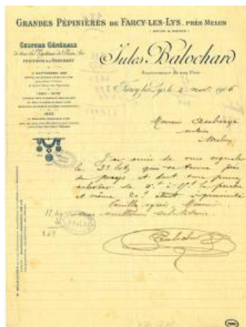
Lettre manuscrite de Jules Balochard (AD77, 34Fi162)

Mais la Seconde Guerre Mondiale et l'industrialisation de Dammarie-lès-Lys auront raison des pépinières. Le territoire de Farcy sera loti, le château de Bellombre démoli par son dernier propriétaire, la société Everitube. Fin d'une « Belle époque ».