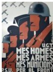
"Més homes, més armes, més municions per al front", affiche, 1936. (AD77, 58 Fi 396)