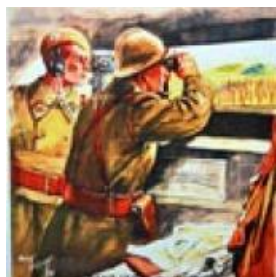
"Engagez-vous, rengagez-vous dans les troupes métropolitaines", affiche, 1938. (AD77, 58 Fi 124)