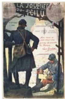
"Journée du Poilu", affiche, 1915.