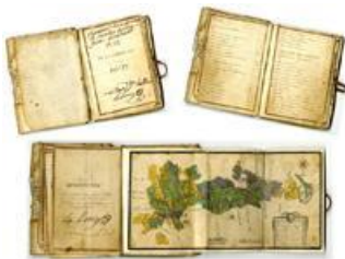
Plan de la forest de Jouy, 1766, acquis par achat en 2014 (AD77, 1 Fi 205).

Les collections iconographiques sont constituées :