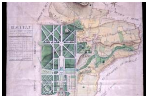
Le plan de la paroisse de Maincy montre l'emprise du château de Vaux-le-Vicomte et de son parc, mais aussi la part prise par les différentes cultures sur le territoire de la paroisse. Papier aquarellé, 65,5 x 65 cm, 1780 (AD77, 1C50/7)

Contrairement aux cadastres dressés dans d'autres généralités, ou encore au cadastre napoléonien, les plans d'intendance ne permettent pas de connaître la taille de chaque parcelle exploitée. Ils sont néanmoins remarquables par leur exhaustivité et leur qualité, tant graphique que technique. Les arpenteurs employés par Berthier étaient en effet très compétents et leurs mesures restent encore en grande partie valides.