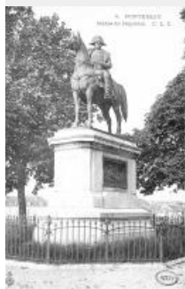
53. Statue équestre de Napoléon Ier à Montereau, bronze fondu par Victor Thiébaud, d'après les plâtres de Charles-Pierre-Victor Pajol, piédestal de M. Loichemolle, carte postale (AD77, 2F15772)

Grâce au soutien financier de Napoléon III, de la mairie de Montereau, du Conseil général et du Ministère des Beaux-Arts, la statue de 3,80 mètres de haut et les bas-reliefs sont fondus en bronze puis exposés au Salon lors de l'Exposition universelle de Paris au printemps 1867. La critique y salue la réussite d'une « œuvre aussi considérable », inaugurée ensuite à Montereau le 18 août 1867.