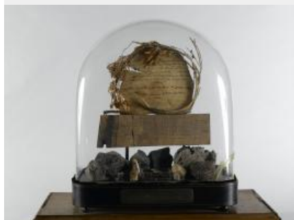
49. Reliquaire de Sainte-Hélène, vers 1845, assemblage minéral et organique sous globe de verre