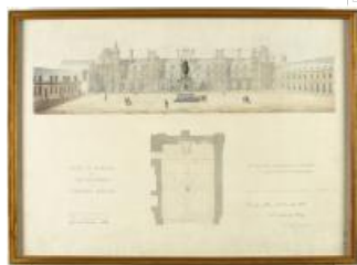
52. Blouet Abel, Projet de statue équestre de Napoléon dans la cour des Adieux, 1851, aquarelle, la vis d'encre, 38,50 x 54