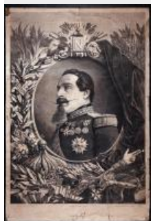
50. Portrait de Napoléon III, estampe, XIXe siècle (AD77, 6Fi1012)

Portrait de Napoléon III dans un médaillon, en buste et de profil. Le médaillon est surmonté d'un blason contenant le chiffre N dans un écusson orné de décors de feuillage et surmonté d'un ruban sur lequel est écrit "Vox populi, vox dei". Sous le médaillon on retrouve la symbolique impériale : la couronne, le sceptre à main de justice, le collier de la légion d'honneur, l'épée avec aigle aux ailes déployées sur le pommeau posés sur des branches de lauriers et de chêne. On voit également un livre dont le titre est " Vie de César ", la rédaction de cet ouvrage est issue d'un intérêt de longue date de Napoléon III pour ce personnage. Sur le côté gauche, le nom des batailles de Magenta et Solferino sont écrits sur un ruban passé entre les branches de laurier et de chêne. Sur le côté droit le tissu orné d'abeilles (symbole d'immortalité et de résurrection, elles sont considérées comme le plus ancien emblème des souverains de France).