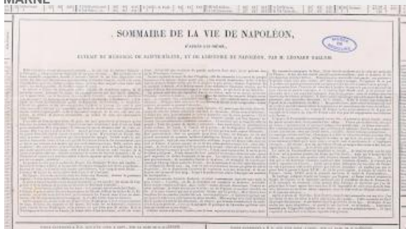
48. Détail de l'indicateur général, Paris : Binet, propriétaire-éditeur, 1834 (AD77, 76J241)