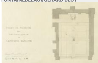
52. Détail du projet de statue équestre de Napoléon dans la cour des Adieux