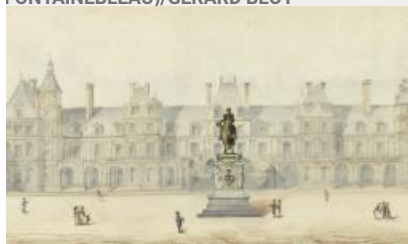
52. Détail du projet de statue équestre de Napoléon dans la cour des Adieux