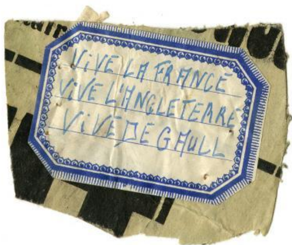
Papillon de résistance "Vive la France, Vive l'Angleterre, Vive de Gaulle" (AD77, SC51243)

Dès 1940, les archives témoignent de faits de résistance dans plusieurs villes seine-et-marnaises, des plus anodins aux plus sérieux. D'abord faite d'actions individuelles non organisées (distribution de tracts, coupure de câbles téléphoniques militaires), la résistance seine-et-marnaise s'organise rapidement en réseaux, comme le réseau au « Hector » de l'hôpital de Coulommiers, auquel participe le médecin Joseph Brau (1891-1975) , ou encore celui de Pierre Georges, dit le colonel Fabien (1919-1944).