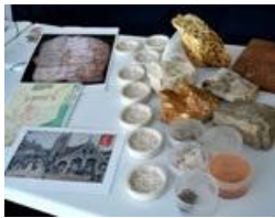
Le matériel de la malle "Habitat rural": sceaux, fac-similés, échantillons de pierre...