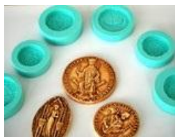
Quelques matrices des sceaux à réaliser dans la malle "Histoire de sceaux".

Cette malle propose de découvrir l'histoire des sceaux médiévaux à travers leurs techniques de fabrication, la signification de leurs utilisations et leurs rôles dans la société médiévale.