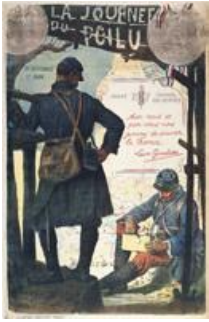
"Journée du Poilu", affiche, 1915. (AD77, 58 Fi 28)