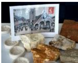
Détail du contenu de la malle "Habitat rural".