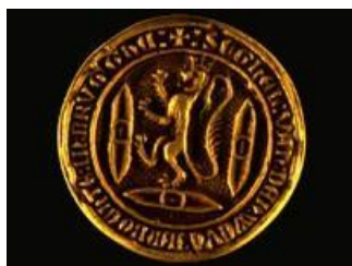
Sceau de la corporation des tisserands de la ville de Bruges (1407) présenté dans la malle "Métiers des villes, métiers de champs".