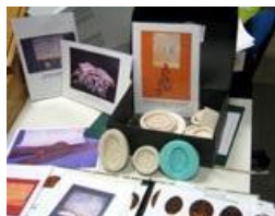
La malle pédagogique "Histoires de sceaux"