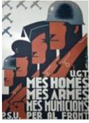
"Més homes, més armes, més municions per al front", affiche, 1936. (AD77, 58 Fi 396)