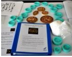
Le matériel de la malle "Métier des villes, métiers des champs": fac-similés, sceaux, plâtre...

Grâce à une sélection de sceaux des communautés de métiers et des sculptures du portail de l'église Saint-Éliphe de Rampillon, découvrez des outils et des métiers du Moyen Âge, qui, pour certains, n'existent plus aujourd'hui.