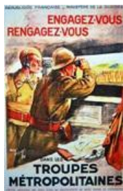
Affiche de la collection Taboureau (AD77 : 58Fi124)

Exposition créée par la Direction des Archives départementales