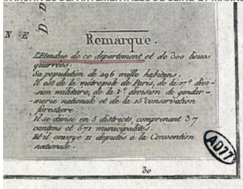
1. Détail de la carte (AD77, 1F1202)