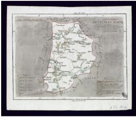
1. Carte représentant le Département de Seine-et-Marne, 1795 (AD77, 1F1202)