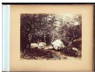
Tirage photographique, frères Delahogue, fin XIXe. Cote : 18 Fi / Seine-et-Marne 1/3

Les Archives départementales ont acquis auprès d'une galerie un album de photographies ayant appartenu aux frères Delahogue. La mention manuscrite suivante portée sur la page de garde « Album de photos des frères Delahogue », ainsi que la signature « Delahogue » figurant sur un rocher sur l'une des photographies peuvent attester qu'ils en sont les auteurs.