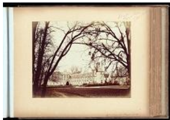
Château de Fleury-en-Bière, 2e moitié du XIXe, frères Delahogue. (AD 77, 18 Fi / Seine-et-Marne 1/12)

scènes de genre et des paysages du Maghreb (surtout l'Algérie).