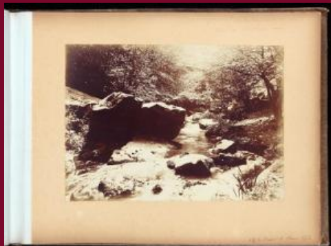
Site en forêt, rocher, 2e moitié du XIXe, frères Delahogue. (AD 77, 18 Fi / Seine-et-Marne 1/2)

Les Archives départementales ont acquis auprès d'une galerie un album de photographies ayant appartenu aux frères Delahogue.