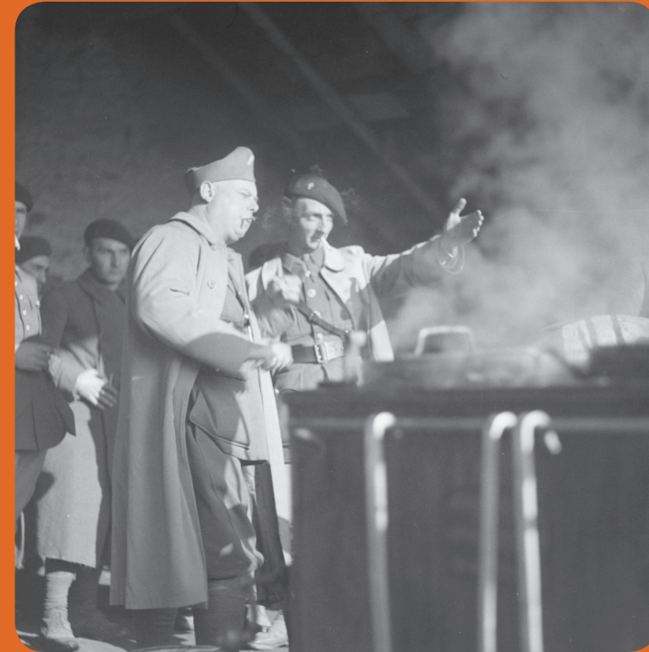
« Le lieutenant de réserve Jean Renoir du SCA (service cinématographique des armées) en compagnie d'un sous-officier du 80 e Régiment d'infanterie, Solgne, le 21 octobre 1939 »

En filigrane, cette conférence mettra en lumière la personnalité caméléon de Jean Renoir qui fera sienne la théorie de son père : « Il faut se laisser aller dans la vie comme un bouchon dans le courant d'un ruisseau ».