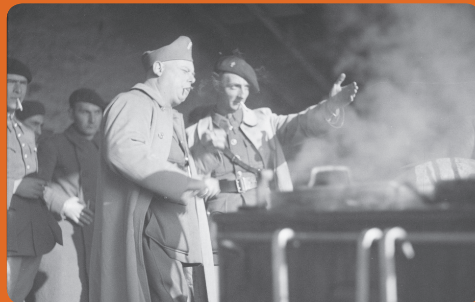
« Le lieutenant de réserve Jean Renoir du SCA (service cinématographique des armées) en compagnie d'un sous-officier du 80 e Régiment d'infanterie, Solgne, le 21 octobre 1939 », photographe inconnu © ECPAD, 3ARMEE 9-C277.

25 AVRIL 2017 À 18H30 À LA MÉDIATHÈQUE DE MEAUX