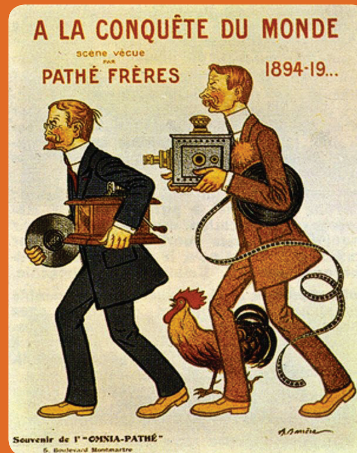
Affiche d'Adrien Barrière intitulée « Émile et Charles Pathé à la conquête du monde » 1906.

Animée par des entrepreneurs, des ingénieurs, des gestionnaires, et surtout par un directeur d'extraction modeste, Charles Pathé, Pathé est une aventure industrielle hors du commun. Elle reflète une certaine histoire économique et sociale de la Belle-Époque, celle de la mise en place d'un commerce de loisirs, accessible au plus grand nombre.