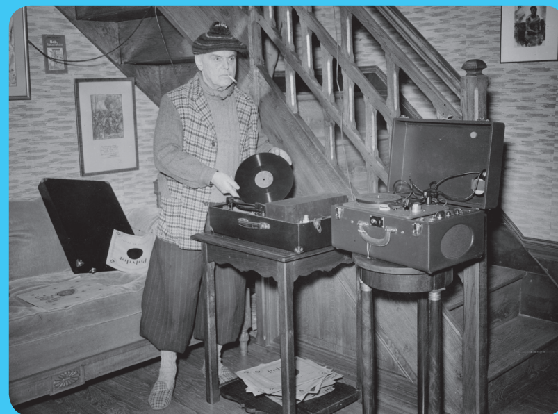
Mac Orlan dans sa maison de Saint-Cyr-sur-Morin