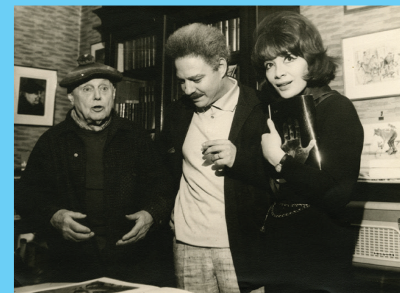
Pierre Mac Orlan, en compagnie du compositeur Philippe Gérard et de Juliette Gréco