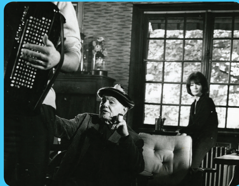
Pierre Mac Orlan et Juliette Gréco dans la maison de l'écrivain à Saint-Cyr-sur-Morin