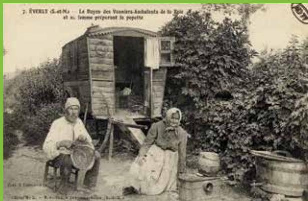
Le doyen des vanniers-ambulants de la Brie et sa femme préparant la popotte, commune d'Everly, carte postale, photographie : L. Simonet (AD77, 2F120709).

Depuis près de 200 ans, il existe en France un régime spécifique pour les « Gens du voyage ». Ce terme purement administratif ne désigne pas une ethnie particulière. Depuis 1972, il remplace dans les textes officiels les mots « forains » et « nomades », utilisés en 1912, ou encore ceux de « saltimbanques » et « chanteurs ambulants » de 1863. Une définition réunit ces appellations : une population Sans Domicile ni Résidence Fixe (SDRF), ayant un mode de vie particulier, à savoir de résider dans un abri mobile terrestre ou/et d'exercer une activité ambulante.