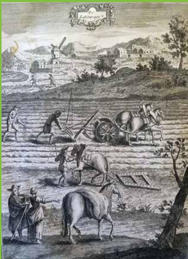
Illustration extraite de « La nouvelle maison rustique ou économie générale de tous les biens de campagne », tome 1, Paris, Durand libraire, 1768.

La Brie compte parmi les premières régions françaises d'agriculture et d'histoire et elle constitue l'un des meilleurs témoignages de l'omniprésence de la vie rurale en France tout au long des siècles, avec ses difficultés souvent cruelles, mais aussi par son rôle essentiel dans l'évolution de notre pays. Cette conférence se fonde sur un essai qui se propose de faire mieux connaître et comprendre la vie rurale en Brie : la vie quotidienne, la vie des champs, de la famille, des enfants, les modes d'acquisition et de transmission des terres, l'influence de la capitale tantôt bénéfique, tantôt spoliatrice, les variations du climat, les maladies, les retombées des événements parisiens et nationaux sur les paysans, etc.